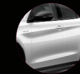
ALFA BUZ BEYAZI