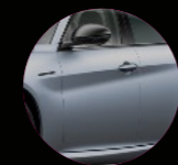
MAT AYIŞIĞI GRİ