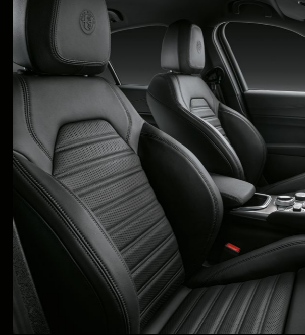
SİYAH DERİ DÖŞEME