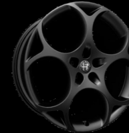
21" ALÜMİNYUM MODALE DARK JANTLAR