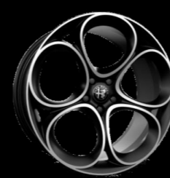
20" ALÜMİNYUM SPORT JANTLAR