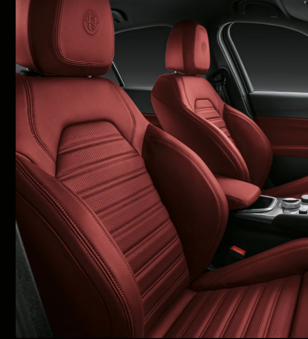
KIRMIZI DERİ DÖŞEME