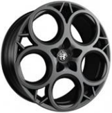
20" Koyu gümüş alaşım jantlar TONALE TRIBUTO ITALIANO