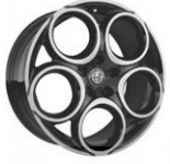
18" Elmas kesim alaşım jantlar TONALE TI DIESEL

Bu jantların şekli ve boyutu, Alfa Romeo'nun cesur ve eşsiz stilini yansıtarak en yüksek performansı sunacak şekilde tasarlandı.