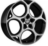
19" Elmas kesim alaşım jantlar TONALE SPECIALE DIESEL VE SPECIALE HYBRID